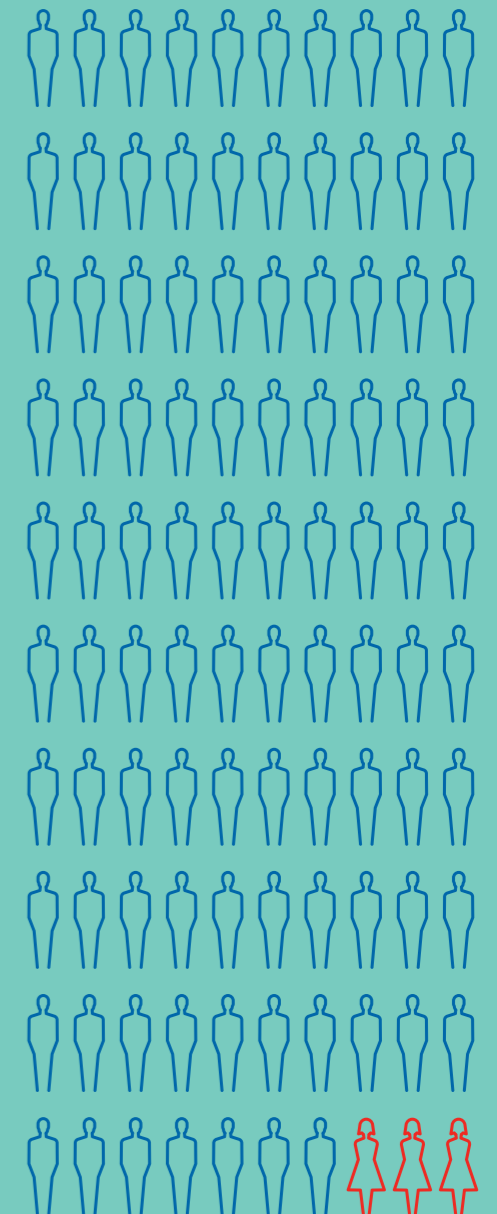
GEMIDDELD IS 97% VAN DE GEREgistREERDE JEUGDIGE VERDACHTEN VAN EEN ZEDENMISDRIJF EEN JONGEN.

Jongeren kunnen seksueel geweld alleen of met anderen plegen. Hoewel jongens meestal dader zijn van seksueel geweld, kunnen ook meiden seksueel geweld plegen.