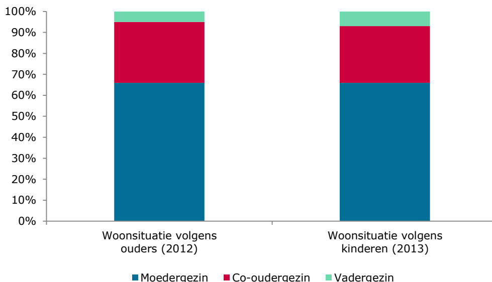
Figuur 1 Woonarrangementen van kinderen na scheiding volgens ouders (2011) en kinderen (2013) a

Figuur 1 geeft weer hoe de woonsituatie van kinderen na scheiding is verdeeld over de drie gezinstypen. Hierbij zijn gegevens beschikbaar van zowel ouders (Westphal, 2015) als kinderen (Spruijt & Kormos, 2014). 3 Ouders, die al dan niet gehuwd waren, rapporteerden over hun woonarrangementen in het jaar 2012. Deze ouders hadden destijds kinderen in de leeftijdscategorie van 4 t/m 16 jaar. Ongeveer 66% van hen vormde een moedergezin, 29% een co-oudergezin, en 5% een vadergezin. 4 Kinderen zijn bevraagd in het jaar 2013. De door hen gerapporteerde woonsituatie heeft betrekking op de leeftijdscategorie 12 t/m 16 jaar oud. Hun ouders waren voor de scheiding gehuwd of samenwonend. Het beeld is vrijwel identiek aan het beeld bij de ouders: 66% van deze kinderen gaf aan in een moedergezin te wonen, 27% in een co-oudergezin en 7% in een vadergezin. Deze verdeling is relatief recent: Eind jaren 90 lag het percentage co-oudergezinnen, met 4%, fors lager (Kalmijn & De Graaf 2000).