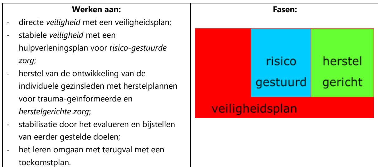
Figuur 1 Model van Vogtländer & Van Arum (2016)

De opbouw van het normenkader is gebaseerd op het model voor gefaseerde ketensamenwerking zoals benoemd door Vogtländer & Van Arum (2016). De ambitie is om een verschil te maken bij het doorbreken van de complexe cirkel van geweld die doorwerkt tot in de volgende generatie. In het model wordt uitgegaan van verschillende elementen waaraan gewerkt moet worden in het aanbieden van zorg, verdeeld over drie fasen: