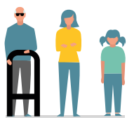
alle gezinsleden actief betrekken