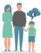
aandacht voor alle levensgebieden

signalering van problemen tot en met de (evaluatie van de) hulpverlening. Er is een behoefte bij kinderen aan duidelijkheid over wat er gaat gebeuren. Steun ervaren, je gehoord en gezien voelen zijn voor kinderen belangrijk bij het herstellen van de gevolgen van kindermishandeling. Maar ondanks dat partnergeweld en kindermishandeling zware gevolgen hebben voor de ontwikkeling van de kinderen, blijkt dat na melding maar de helft van de kinderen een vorm van hulpverlening heeft gekregen.